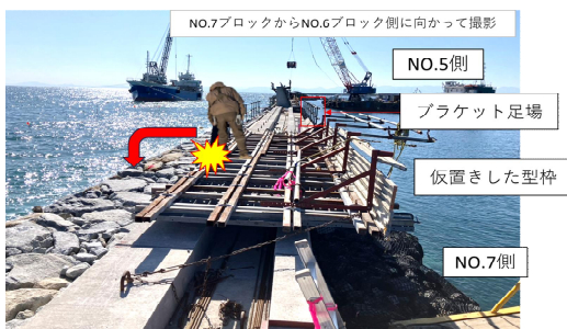
事故発生時の状況