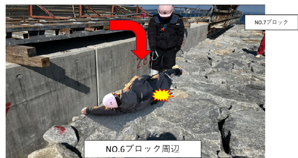
事故発生時の状況(再現)